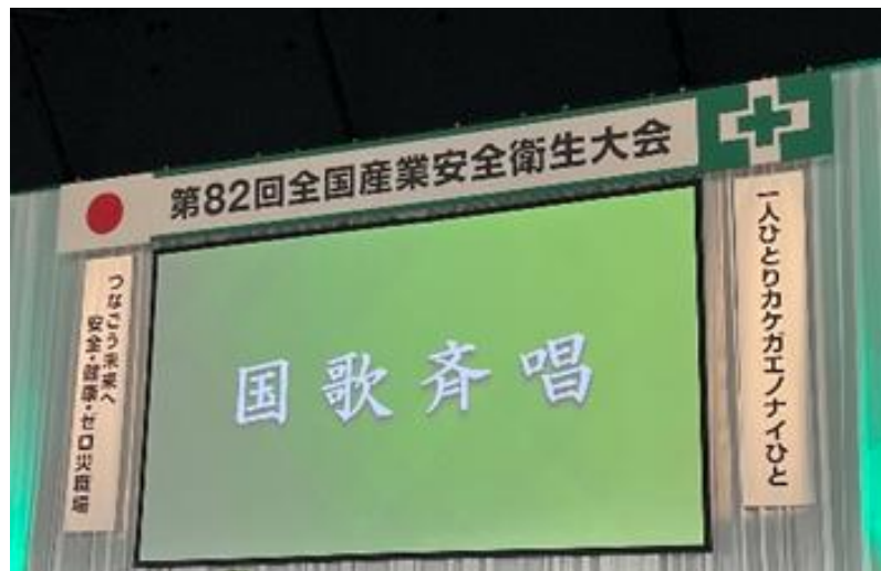
圖1 大會的舞台兩側之長幅

安全衛生的知識下，職業災害有下降趨勢。但分析職業災害之行業，則以製造業和營造業佔7成左右，多為機械設備之捲夾傷害，其次則為化學工廠爆炸事故等重大災害較為常見(圖2)。