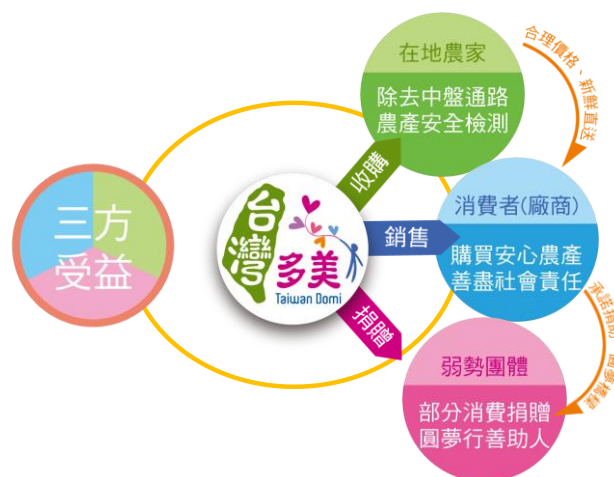
台灣多美希望聯盟三方受益示意圖

綜合以上種種誘因，台灣多美希望能夠成為消費者(企業)、在地農家、弱勢團體三方受益的友善橋梁(如下圖所示)，並且將延續社會企業永續發展的精神，透過不斷的將愛與關懷轉化成實際的幫助讓更多人能感受得到。