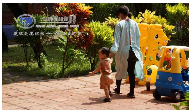
善牧台南嬰兒之家家園剪影

台南嬰兒之家提供了 2 歲以下嬰幼兒 24 小時生活照顧及健康維護，其所需之費用都仰賴社會大眾的熱心捐助，以支持她們繼續用愛灌溉保護這些脆弱的幼苗。在這裡，是許多小寶貝人生中第一站停靠的港灣，不是所有的小生命都是備受呵護、眾所期待的來到這世界上，當稚嫩的他們在現實世界中顯得如此渺小又脆弱的時候，社會中你我的援助，就是支持他們堅強成長的力量。