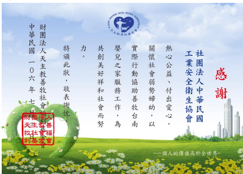
善牧台南嬰兒之家致贈感謝狀予中華民國工業安全衛生協會