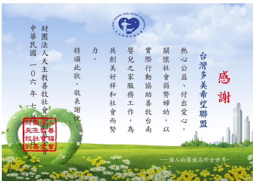
善牧台南嬰兒之家致贈感謝狀予台灣多美